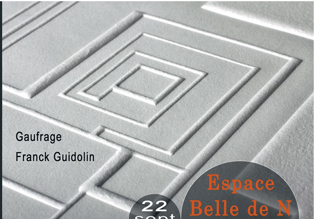
Gaufrage Franck Guidolin